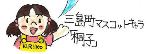
三島町マスコットキヲ桐子