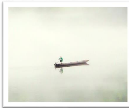
・モリは、湿度が高く、気温が下がった朝方に発生しやすいです。

〈大林ふるさとの山〉 ・山菜やカタクリが、山一面に咲いています。 ・自然豊かな場所で、静かなので、とても落ち着きます。