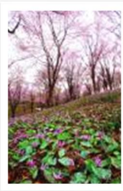
・カタクリは3~6月に咲きます。 ・春は、オオヤマサクラも咲きます。