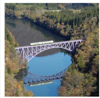
(この写真はみしま宿の近くにあるビューポイントからとりました。)