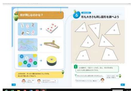
〔デジタル教科書5年算数〕 ～書き込みも自由自在です。