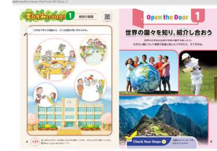
〔デジタル教科書6年外国語〕 ～クリックすると音声も聞けます。