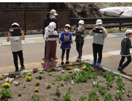
〔理科の観察学習の様子から〕～外で撮ったものを、教室でじっくりカードにまとめます。