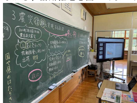
〔社会科の調べ学習の様子から〕～三島町ではどんな取り組みがされているのかな？

1人1台端末の本格利用がスタートして、2年目を迎えています。文部科学省も言っているところの、「全ての子供たちの可能性を引き出す個別最適な学びと協働的な学びを実現するためには、学校現場におけるICTの積極的な活用が不可欠」との観点から推進されたGIGAスクール構想。三島小学校においても、より有効な活用の推進を目指しているところです。特に、今年度は三島町では小学校5・6学年において、「算数科」と「外国語科」で、学習者用デジタル教科書の使用が始まることとなり、間もなく子どもたちも本格的な使用へと入ってまいります。また、モバイル環境の準備も進みつつあり、今後ますます、新しい学びの姿へと前進していくことと思います。同時に、様々な活用の仕方に伴い、ICTの活用にあたっての児童の健康への被害や情報モラルに関する教育も必要となります。子どもたちにとって有益な学びへとつながるよう、学校でも研修を進めながら、活用推進を図ってまいります。