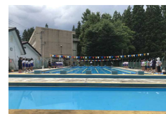
交流水泳学習（5・6年生）