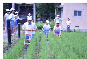
田んぼの草取り（3～6年）