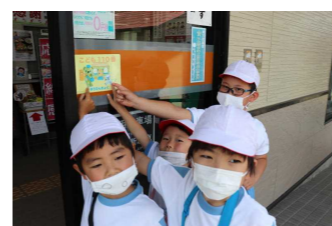
つうがくろを歩こう（1年）