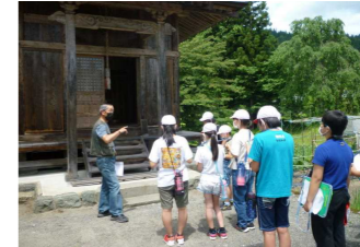
西方歴史探検（5・6年生）