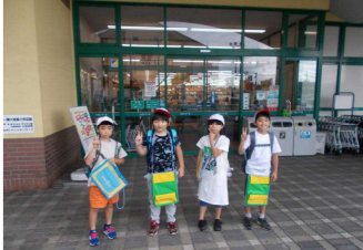
スーパーマーケット見学（3年生）