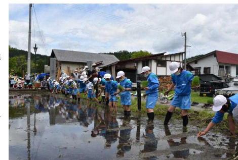
3～6年生による田植え

5月26日(水)、「びおたんクラブ」の皆さんにご協力いただき、3～6年生の児童が三島神社前の学校田で田植えを行いました。子どもたちは泥の感触を肌で感じながら、昔ながらの方法による貴重な体験をすることができました。これからも田の草取りや、水の管理、収穫などで大変お世話になります。