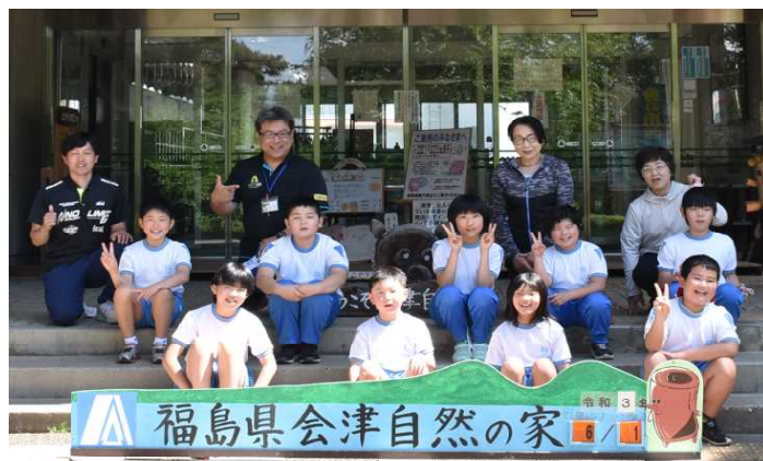
4・5年生で集合写真