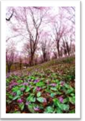
・カタクリは3~6月に咲きます。 ・春は、オオヤマサクラも咲きます。