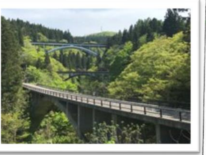
・冬も雪がかたかたしているので、ぜひおこしください。