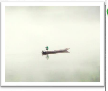
・モリは、湿度が高く気温が下がった朝方に発生しやすいです。

〈大林ふるさとの山〉 ・山菜やカタクリが、山一面に咲いています。 ・自然豊かな場所で、静かなので、とても落ち着きます。