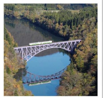
(この写真はみしま宿の近くにあるビューポイントからとりました。)