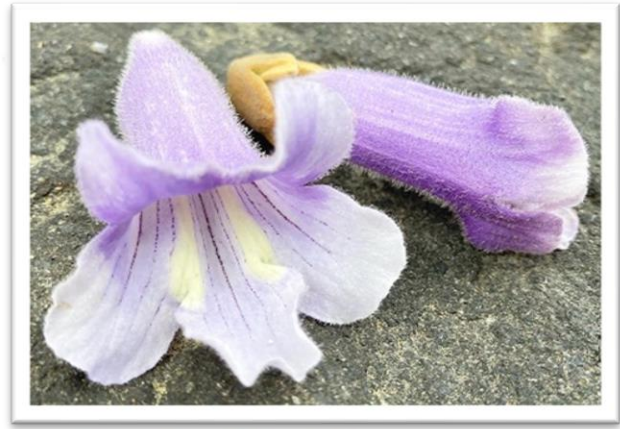
三島町の特産桐の花

制作：福島県大沼郡三島町立三島小学校6年 問い合わせ先 0241-52-2442