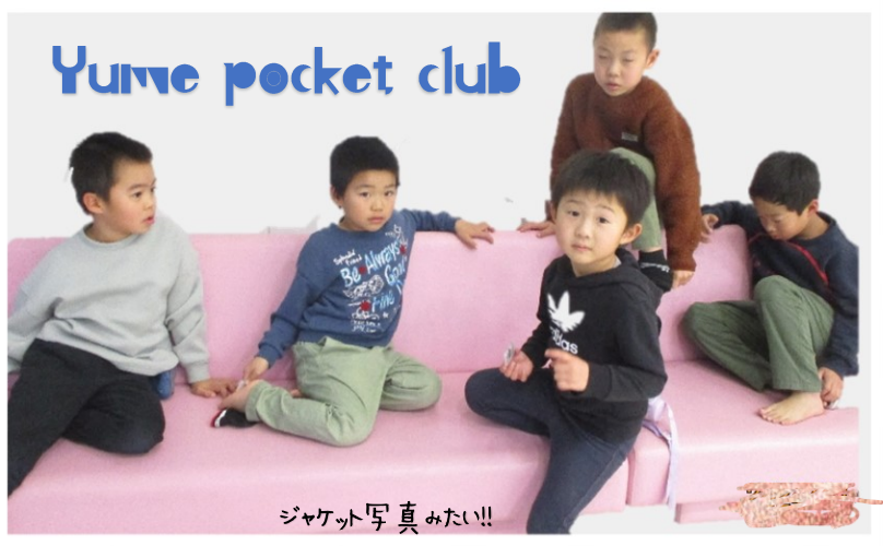
ジャケット写真みたい!!