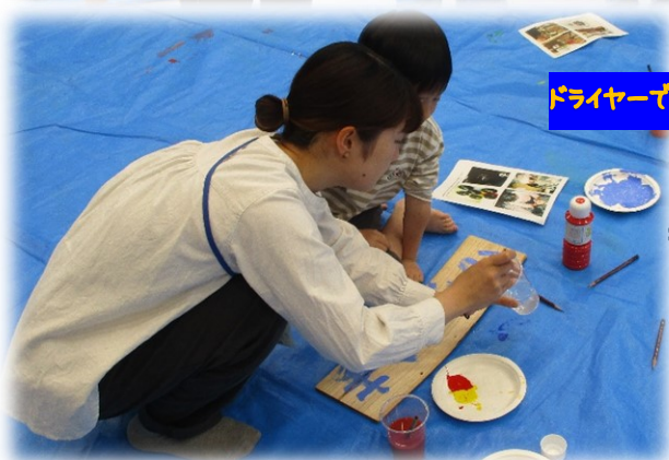
ドライヤーで乾かします