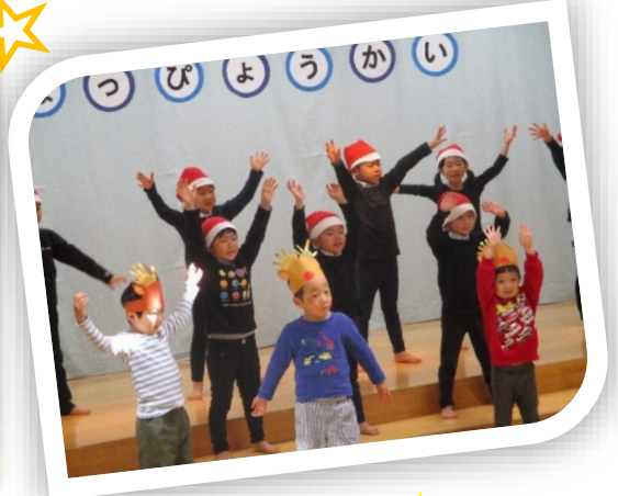
「えいごであそぼう」3、4、5歳児