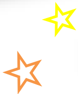
「アンダー・ザ・シー」3、4歳児