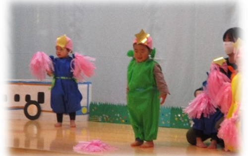
「おやつをたべよう」1、2歳児