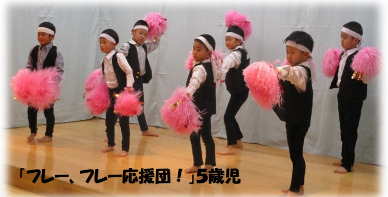
「フレー、フレー応援団！」5歳児