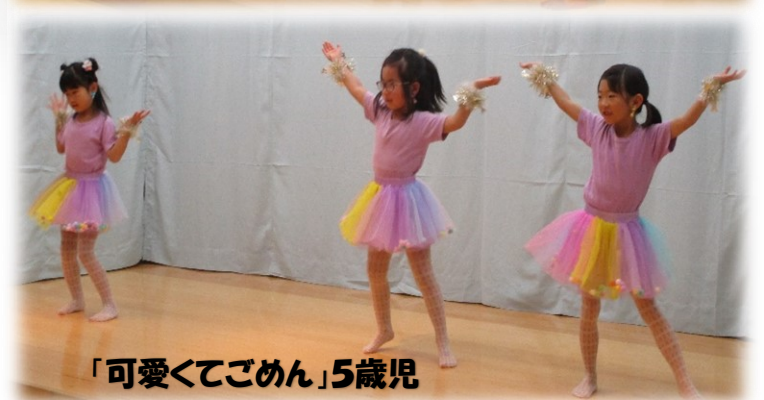
「可愛くてごめん」5歳児