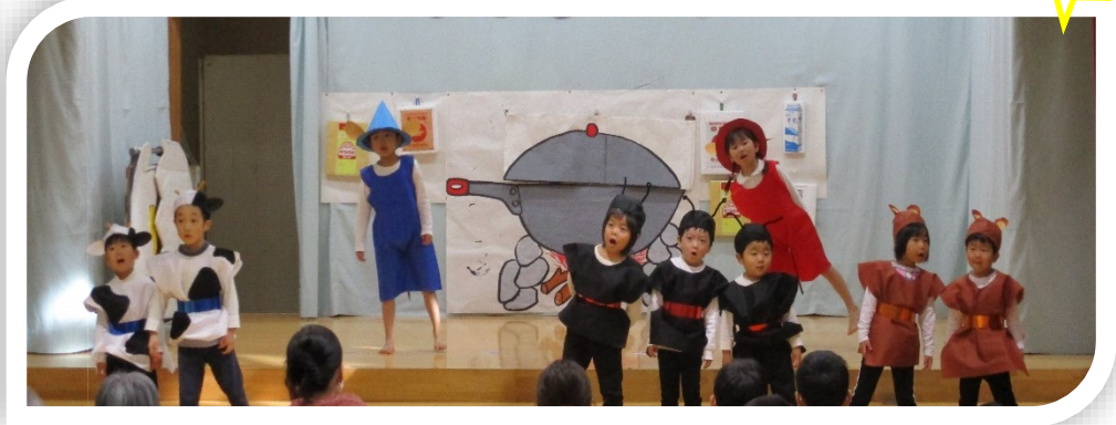
劇「ぐいとぐら」3, 4, 5歳児