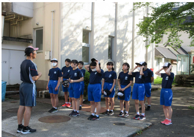
【特設駅伝部の練習で心も鍛える子どもたち】

【校長の一言】学校ホームページを定期的に更新中です。現在83,300閲覧(令和4年7月号発行時66,000閲覧)、1年間で17,300閲覧でした。1日50閲覧以上と全校生徒の4倍も！