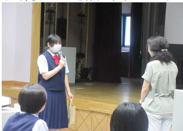
【生徒代表のお礼の言葉】