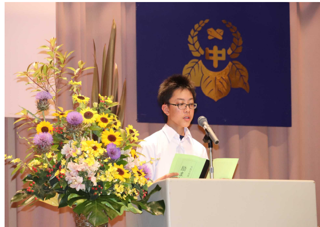
【先輩からの激励の言葉】