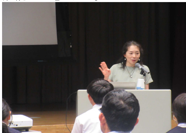
【夢を叶えた経験を語る十文字さん】