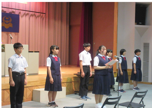
【立志式を迎えての誓いの言葉】