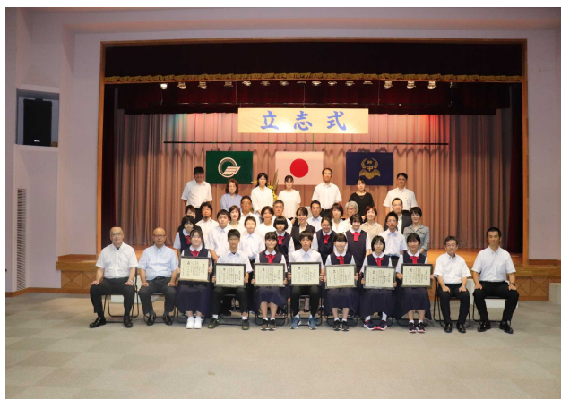
【全校生と2年生保護者、教職員とで】