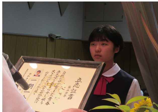
【立志証書を授与される2年生】