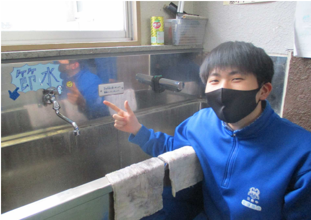
【節水を呼びかける掲示をしました】

「ナッジ理論」とは、「足跡のシールを貼っておくと、自然と足跡に合わせて歩いてしまう」ように、無意識に行動をさせてしまう工夫の事です。