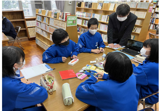
【異学年縦割りの班で考えました】