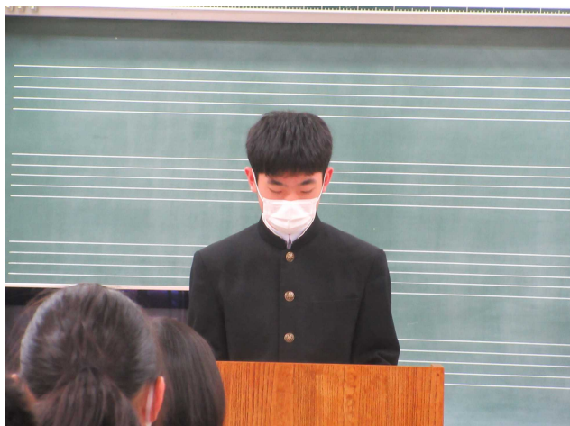
【始業式で抱負を発表する3年生】