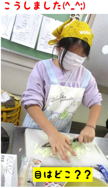
こうしました( ^_ ^ )