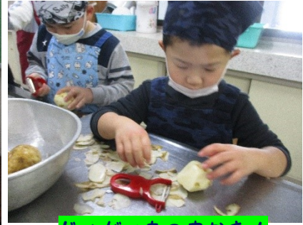
じゃがいもの皮むき!