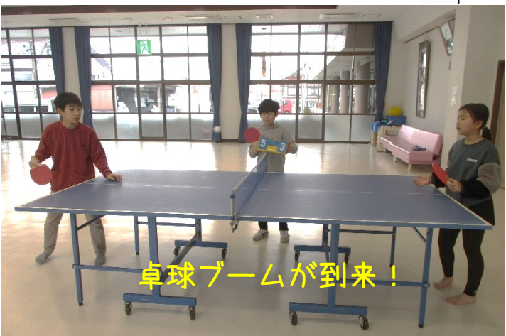
卓球ブームが到来!