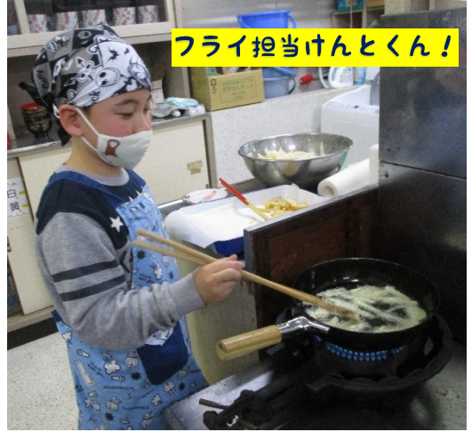
フライ担当けんとかん!

この日作った料理は、「ビックマック?!、フライドポテト、ブロッコリースープ」 です。みんな積極的に料理を楽しみ、おいしく食べて、お片づけも頑張りました。 今度は是非、お家でも作ってみてください☆