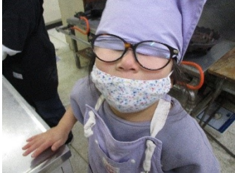
玉ねぎを切 ってたら 涙がでてき て・・・