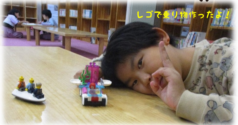
しごで乗り物作ったよ！