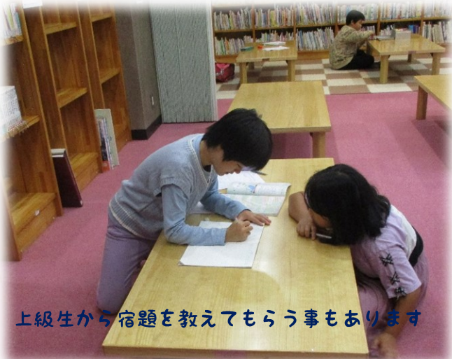
上級生から宿題を教えてもらう事もあります