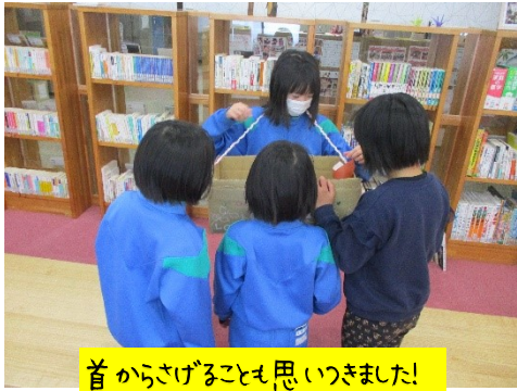
首からさげることも思いつきました!

ご家庭でも子どもたちの言葉づかいが気になることはありませんか？お友だちに対してきつい言い方や乱暴な言葉を使っていたり、支援員に対しても「わかってる！」や「今、これやってんの！」と言いかえされることもしばしばあります。言葉は「心」を伝えます。お互いが気持ちよくなるような、やさしい言葉づかいを心がけていきましょう！